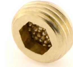
Prove di flusso / flow test